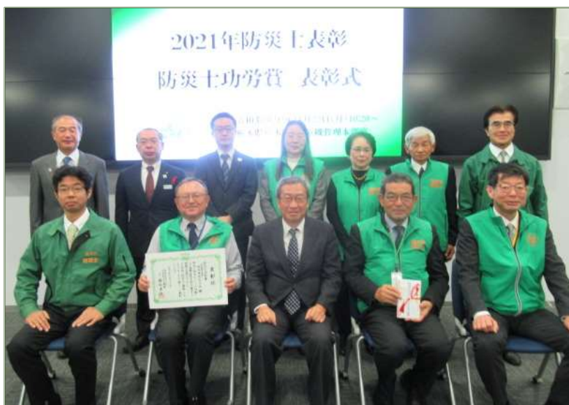
前列中央、原日本防災士機構理事長を囲んでの記念撮影

今回、防災士としての活動及び社会貢献活動等に関して顕著にして他の模範となる大きな功労があったことが認められましたことは、当会会員の日頃の活動の賜物であり、今後ともこれを励みとして、なお一層、志気を高め、県防災士会一丸となって活動に取り組むことにより、当会の更なる発展と防災士制度の更なる進展に寄与したいものです。